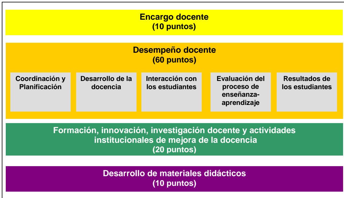
Figura 1: Modelo de evaluación

El modelo se fundamenta en el análisis de información procedente de distintas fuentes: