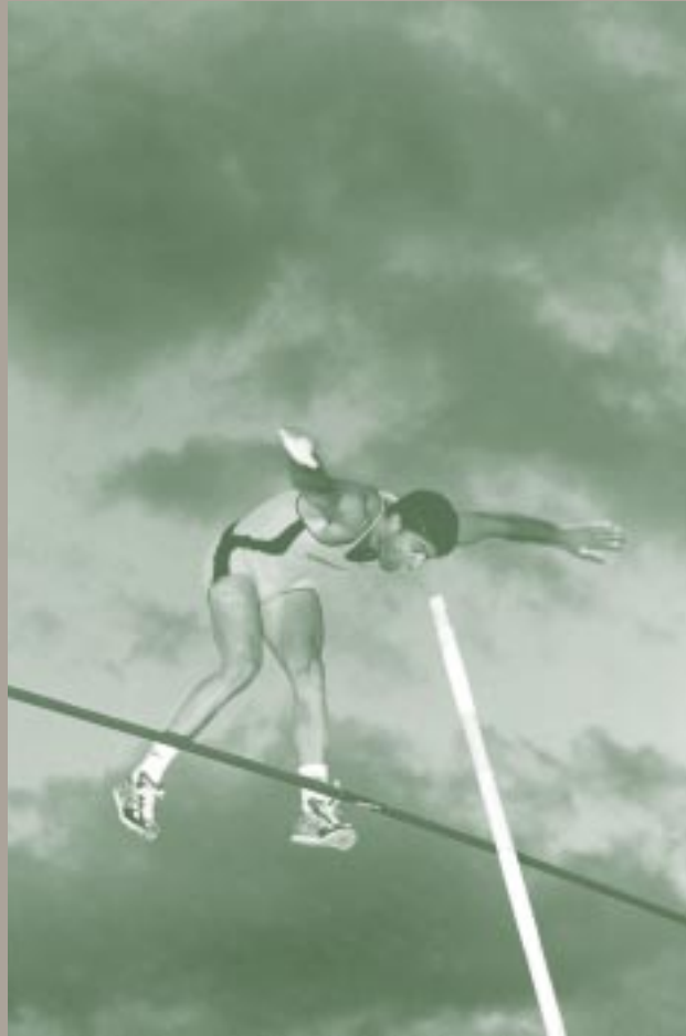
Obra de Pablo Salto-Weiss