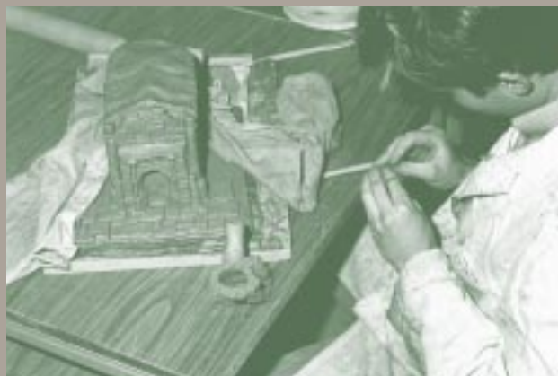
Alumno del Aula de cerámica