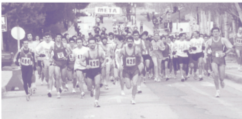
El Cross del Rector despidió las actividades deportivas del año 1999. Como en ediciones anteriores, contó con una importante participación