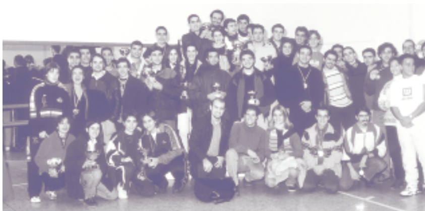
Los ganadores de las distintas actividades deportivas del Torneo de Navidad de la Autónoma recogieron sus trofeos el pasado 17 de diciembre

Teléfonos: 91-397 43 59 y 46 45 (de 9 a 14 horas)