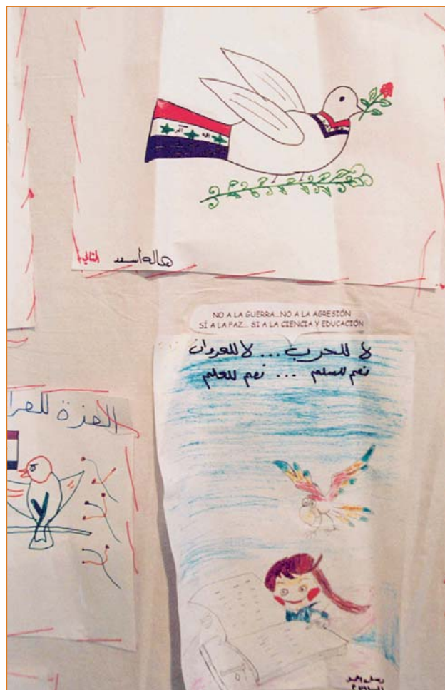
Dibujos realizados por niños iraquíes

En las conferencias se analizaron, entre otros asuntos de relevancia social, todo lo relativo a las políticas de economía social, su situación en la Unión Europea, su política fiscal, y sus agentes: cooperativas, fundaciones, asociaciones y empresas de inserción. Las experiencias e importancia de la nueva Economía Social en las diferentes áreas del Tercer Sector , profundizó en temas de inserción social, medio ambiente, cooperación internacional, drogodependencia, discapacidad, migraciones y género.