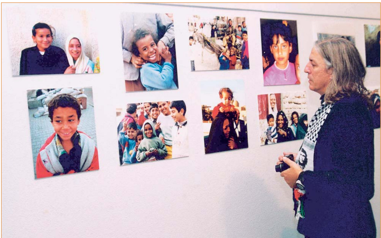
Exposición Palestina e Iraq: dos pueblos en la encrucijada. Fotografías realizadas antes de la guerra.

La exposición de fotografías y documentos gráficos organizada por la Asociación Pablo de la Torriente Brau, que pudo contemplarse en la sala del pabellón B, aportó una información viva sobre la situación de estos dos países, en un ámbito, el universitario, "donde –según afirmó el profesor Montávez– se da el intercambio de opiniones y se defiende la libertad con argumentos. Para entender la causa de Palestina e Iraq, hay que conocer el tema, porque cuánto más se conozca, más persuadidos estaremos de la absoluta legitimidad de la lucha por la defensa de los derechos del pueblo palestino y de Iraq".