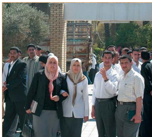
Exposición de fotografías. Estudiantes universitarios en Iraq.