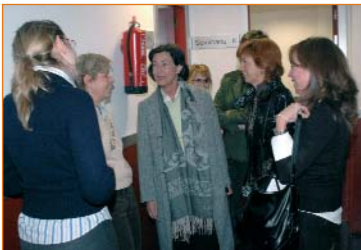
La directora general de Universidades en la inauguración del Centro de Estudios de Posgrado

Creo que se debería de fomentar algo más el papel activo de los estudiantes en sus propios estudios. Todavía hay demasiadas clases tradicionales con una participación poco activa de los estudiantes en su propia formación.