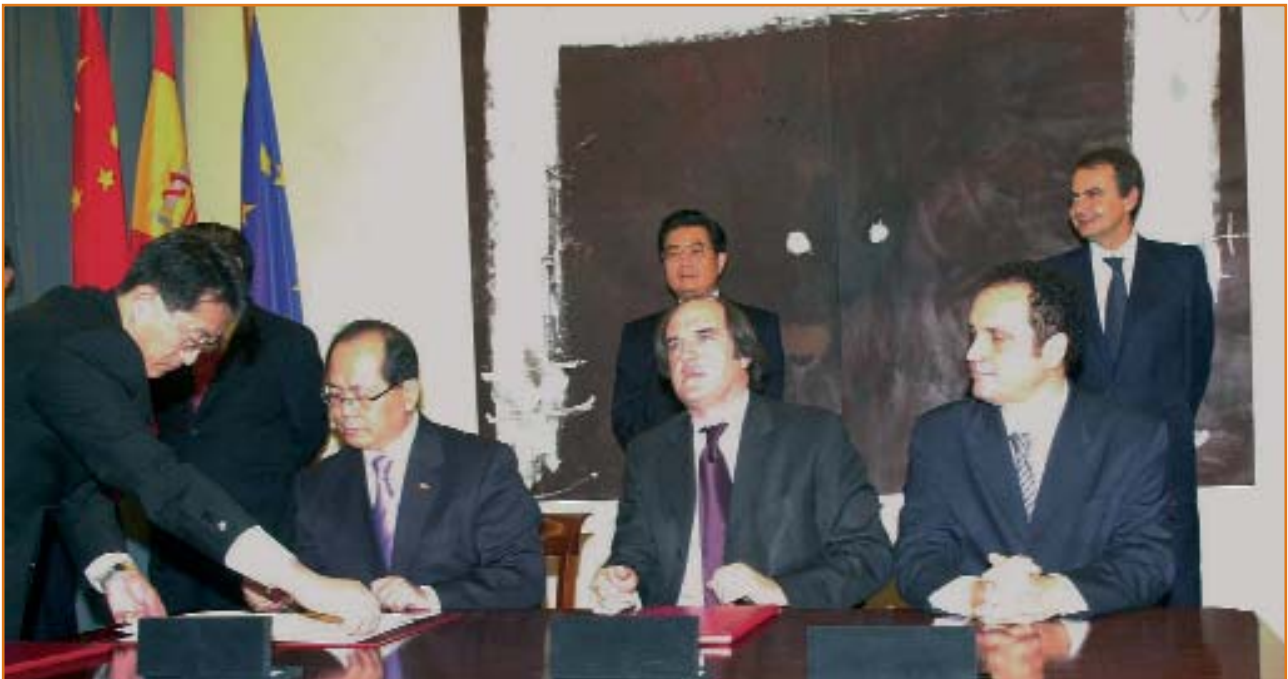
El embajador de la República Popular China en España en representación de la Oficina Nacional de la Enseñanza del Chino como Lengua Extranjera, Qiu Xiaoqi, el rector de la UAM, Ángel Gabilondo, y el director general de Casa Asia, Ion de la Riva Guzmán de Frutos. Al fondo, los presidentes Hu Jintao y Rodríguez Zapatero.