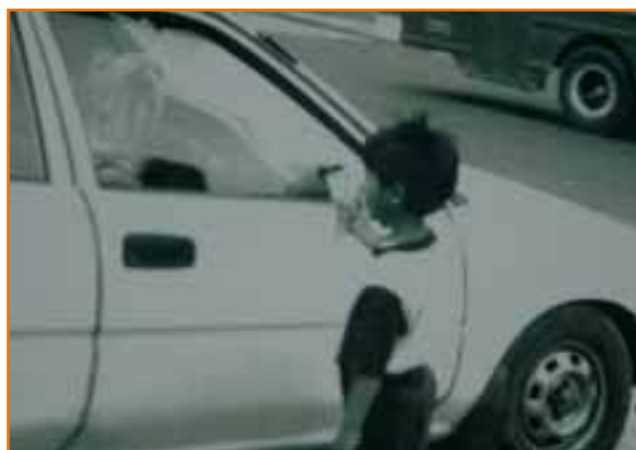
Niños, niñas y adolescentes trabajadores