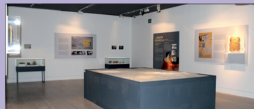
Sala de la exposición

Entre el 8 de abril y el 29 de mayo de 2016 tuvo lugar, en el Museo Arqueológico Nacional, la exposición "En los confines de Oriente Próximo" financiada por el Departamento de Antigüedades del Emirato de Sharjah. La exposición daba cuenta de veinte años de hallazgos del departamento y a la vez, de los veinte de trabajo de la misión española en al Madam (Sharjah), entre 1994 y 2014. La muestra fue organizada por el Grupo de Investigación de la UAM "Culturas, tecnologías y medio ambiente de las sociedades de Oriente Próximo antiguo", y en el corto tiempo en el que pudo estar abierta mereció la visita de numeroso público y una generosa atención en los medios.