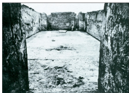
Salón del trono del Palacio de Mari

Durante los años sesenta del siglo XX, muchos estudiantes europeos se sintieron atraídos por el Oriente Próximo antiguo tras la lectura de un libro fascinante, de magníficas reproducciones b/n en huecograbado: Sumer (L'Univers des Formes, Gallimard, Paris, 1960-61. Ed. española: Sumer , Aguilar, S. A., Madrid 1969). Por entonces también y en el seno de las universidades, obras más exigentes fueron clave en la formación de jóvenes orientalistas: Archéologie mésopotamienne. Les étapes (Éditions Albin Michel, Paris 1946 –con Archéologie mésopotamienne. Technique et problèmes (Éditions Albin Michel, Paris 1953)-, y Ziggurats et tour de Babel (Éditions Albin Michel, Paris 1949). De todos ellos era autor el director del Museo del Louvre y descubridor de Mari, André Parrot, todo un mito de la arqueología francesa en Oriente. Porque en la Europa de postguerra, Parrot y el palacio de Mari evocaban la última gran excavación en Oriente y el fin de toda una época.