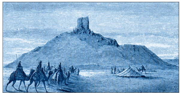
Birs Nimrud. S. Newman, 1876 (M.T. Larsen 1996: 47)

Durante sus viajes iba tomando notas que tal vez pensaba ampliar luego. Pero recién vuelto a “tierras de Castilla”, como diría el anónimo prologuista y editor de sus recuerdos difundidos en hebreo, murió sin llegar a hacerlo cuando pensaba emprender un nuevo viaje.