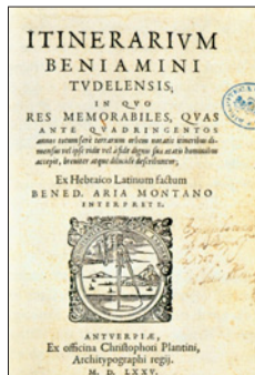
B. de Tudela. Viaje (1575), versión latina de Arias Montano

Benjamín de Tudela nació hacia 1130 en esa localidad navarra, hijo de rabino. Como su padre, fue maestro en la Torá y la Halajá, bien formado en las escrituras del judaísmo. Culto, políglota, conocedor de la Antigüedad clásica y el Medioevo hasta su época, era hábil en los negocios y conocedor de muchos oficios. Por curiosidad, interés en sus hermanos lejanos y tal vez por buscar suerte en el comercio de piedras preciosas, hacia 1165-1166 emprendió un largo viaje desde su Tudela natal hasta el corazón de Iraq e incluso más allá. Por Aragón, Francia, Italia y Bizancio llegó en barco a Palestina. Visitó luego las comunidades hebreas, las ciudades y las grandes ruinas que le atraían sobremanera y de las que hizo enjundiosos comentarios: Baalbek, Palmyra, Nínive y Babilonia entre otras. Creyó ver en las de Borsippa-Birs Nimrud, cercana a aquella, y en los restos de su enorme zigurat los de la torre de Babilonia, y la huella del rayo de Dios en las grietas que la hieden. Habló de geografía y costumbres, de la secta de los asesinos y del Viejo de la Montaña, de cosas y lugares nunca vistos en tierras de Occidente.