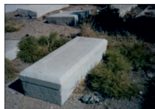
Tumba de X. Hommaire en Isfahán