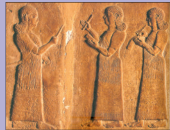
Fragmento de Nimrud (Británico)

En el primer cuatrimestre del curso, entre los días 26 y 30 del próximo mes de noviembre tendrá lugar la XX Semana Didáctica sobre Oriente Antiguo , dedicada en esta ocasión al tema “ Veinte años de estudios sobre Oriente Próximo y Medio ”. Se impartirá un ciclo de lecciones a cargo de especialistas, acompañado de una pequeña exposición en el Aula Didáctica Antonio Blanco Freijeiro, aprovechándose la ocasión para presentar varias publicaciones.