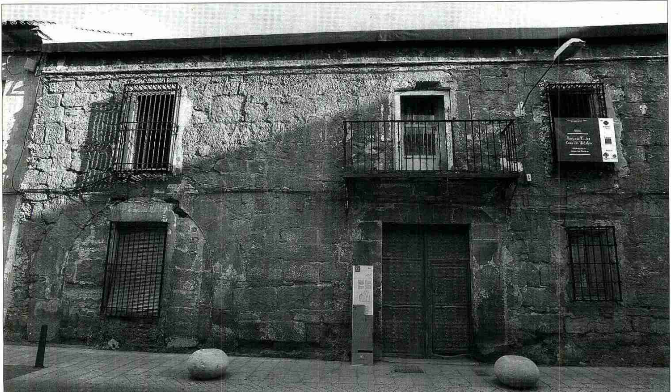
Detalle de la fachada de este edificio emblemático, donde se puede apreciar un arco y la puerta de acceso principal.

parte de la hoy llamada Casa del Hidalgo. El acceso actual desde la calle al zaguán se hace a través de una gran portada adentellada con balconada característica de finales del XVII y comienzos del XVIII. Desde este último y a través de otra gran puerta de madera se accede a un patio con siete columnas de estilo toscano, en torno al cual se articulan las dos plantas de la vivienda.