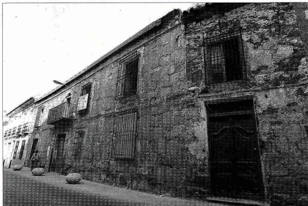
Imagen general de la fachada de los dos edificios que conforman la Casa del Hidalgo de Alcázar de San Juan.

El edificio que nos ocupa se clasifica dentro de lo que se ha dado en llamar 'casas patio', los cuales junto a las 'casas patio'