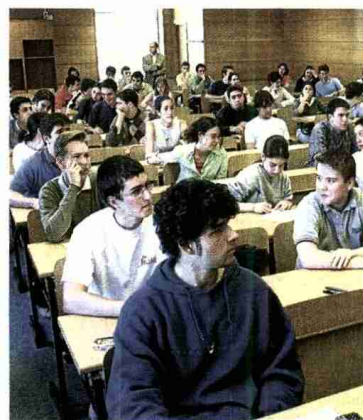
Alumnos en clase y examinándose en el aula de una universidad española.