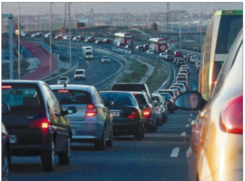
Atasco en la carretera de Colmenar Viejo (M-607) el pasado martes.

Y para ello Folgado da varias recetas que deberían cocinarse de manera inmediata: deberían