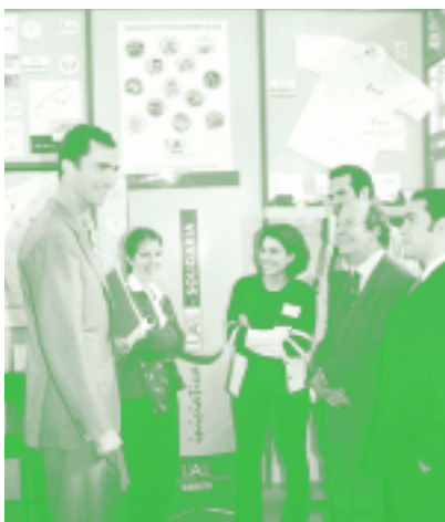
S.A.R. D. Felipe de Borbón visitó el stand UAM-Solidaria.

La Universidad Autónoma de Madrid acogió por segundo año consecutivo las jornadas universitarias de voluntariado Voluntarios 2001 .