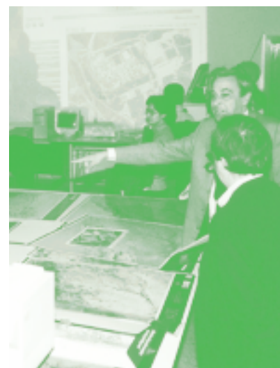
El Servicio de Cartografía fue visitado durante la Semana de la Ciencia.

El premiado mapa de Cantabria se ha impreso originalmente a escala 1:200.000 con un sombreado virtual del relieve obtenido mediante un procedimiento patentado por nuestra Universidad. Sin perder el rigor cartográfico, los mapas de la serie permiten una comprensión directa de los fenómenos geográficos. La resolución original de las imágenes Landsat es de 30 metros, lo que proporciona una precisión tan detallada, realizada por la utilización de los canales RGB con un depurado procedimiento, que logra colores naturales de gran nitidez.