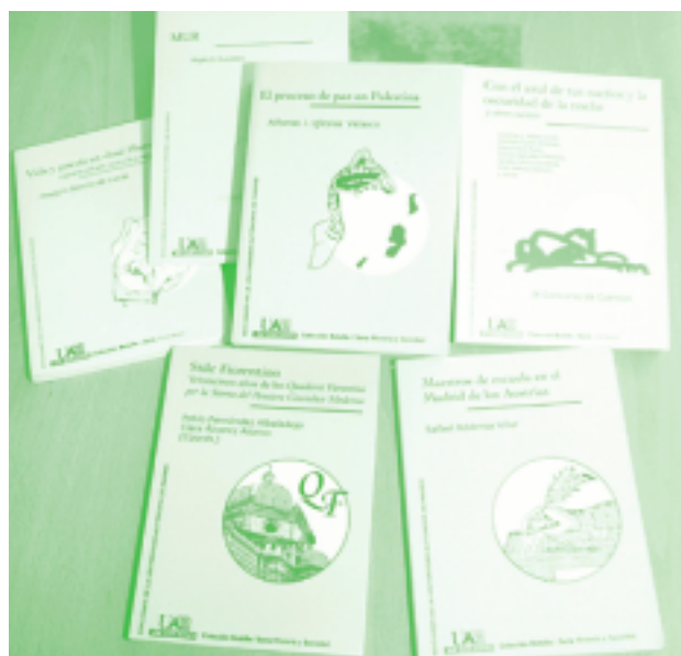
Ejemplares de la Colección bolsillo editada por el Servicio de Publicaciones de la UAM.

El premio, que se concedió por unanimidad, se entregará el 16 de noviembre en la Universidad Jaume I de Castellón, universidad en la que este año tendrá lugar la celebración de la asamblea anual de la Asociación de Editoriales Universitarias Españolas.