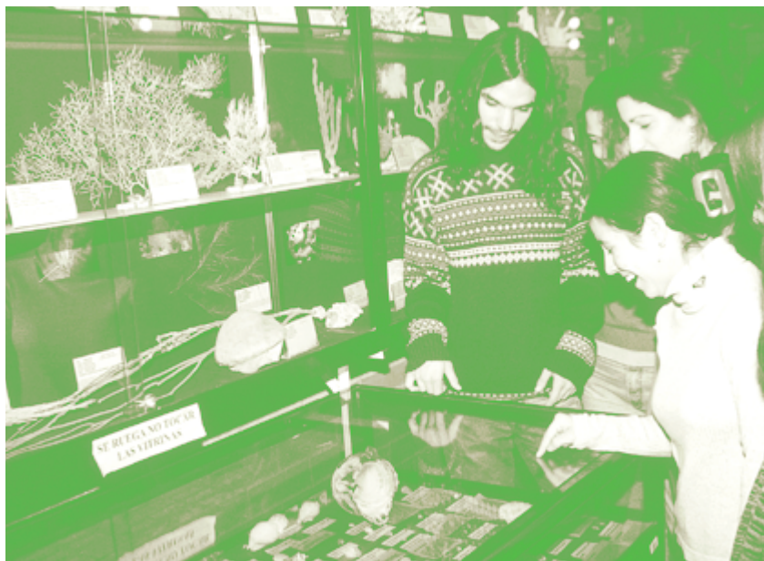
Alumnos de Biológicas de la Autónoma.

Generalmente, las instituciones que organizan los cursos son las propias universidades de la Comunidad de Madrid, seguidos por los organizados por el Gobierno autonómico y local. Es reseñable la lealtad de los licenciados respecto a la