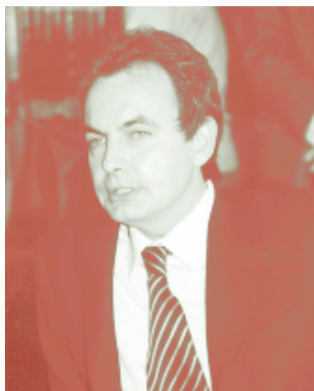
José Luis Rodríguez Zapatero

una vulneración clara del artículo 9 de la Constitución porque quiebra el principio de igualdad de oportunidades educativas". Afirmó, asimismo que "hay dos cosas en juego, la igualdad de oportunidades y el futuro del sistema de investigación y desarrollo del país". El líder socialista manifestó que se debe buscar una universidad al servicio de la sociedad, en la que se pueda conjugar la ecuación calidad-cantidad. Dirigiéndose específicamente a los estudiantes; Rodríguez Zapatero pidió que recuperen la política en la universidad, "si no a los políticos, si la política, que nunca se perdió, pero que en los últimos tiempos dormita".