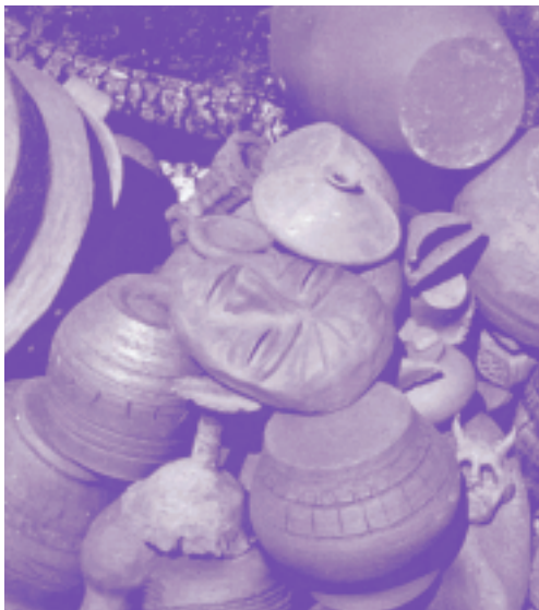
Cocción étnica, realizada por el Aula de Cerámica

Instalaciones del departamento de Expresión Artística de la Escuela Universitaria La Salle.