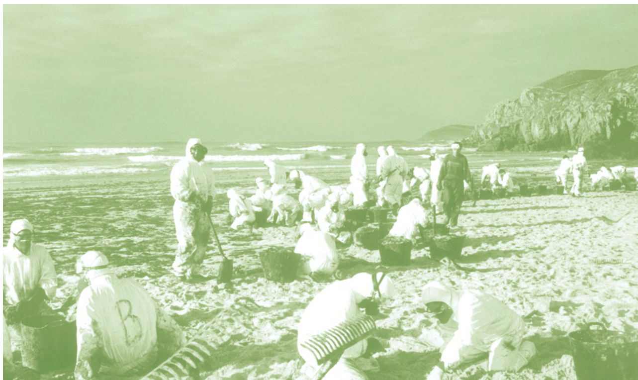
Voluntarios de la Autónoma recogiendo chapapote en una playa de Galicia.