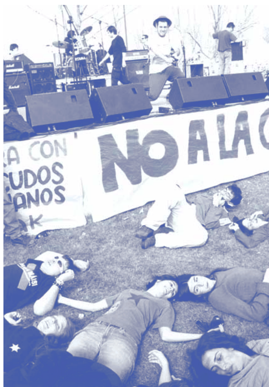
Fiesta contra la guerra en la UAM

creemos que es nuestra obligación moral pronunciarnos en una situación de la importancia de la que estamos viviendo. Esto está en sintonía con el papel que pensamos debe jugar la Universidad como referente del pensamiento y la cultura de un país. Por eso queremos hacer un llamamiento a todos los colectivos que conforman las universidades y centros de investigación para que se unan a nuestra iniciativa o adopten otras similares”. CCOO de la UAM y del CSIC convocaron una concentración para manifestar su posición a favor de la paz y en contra de la intervención militar en Irak. Durante el acto se leyó un manifiesto, apoyado por la Confederación Internacional de Organizaciones Sindicales Libres, llamando a la