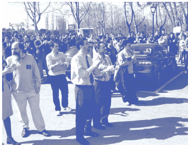
Concentración frente al Rectorado

La Conferencia de Rectores de las Universidades Españolas coordinó la jornada celebrada el 5 de marzo en el ámbito de las universidades, y en nuestra Universidad se produjo una concentración frente a la puerta del Rectorado y la lectura del manifiesto “a favor de la paz y contra la guerra de Irak”, suscrito por un amplio número de rectores.