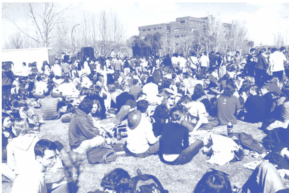
Los estudiantes dijeron NO con música