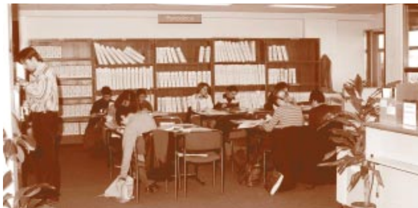
Biblioteca del Rectorado