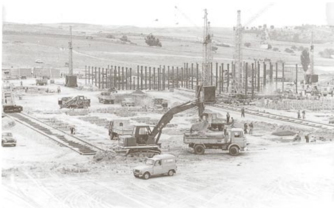
Treinta años separan estas dos imágenes. Arriba, fechada el 20 de junio de 1970, vista de las obras de construcción del campus de Cantoblanco. Abajo la imagen moderna de la UAM.

La exposición ha quedado plasmada en una guía, distribuida entre el profesorado y el personal de la UAM, donde se recoge lo más destacado de la muestra. Pero la importancia de esta publicación radica en su interés como documento histórico, narrador de la breve pero fructífera historia de esta Universidad. Los motivos por los que fue construida en este enclave. Los avatares políticos que sufrió. La sucesión de rectores y crecimiento urbanístico. Y uno de los sucesos que con mayor fuerza puso a la Autónoma como protagonista de la libertad, la solidaridad y la no violencia: el asesinato de Francisco Tomás y Valiente el 14 de febrero de 1996. Animamos, desde las páginas de Cantoblanco, a todos los miembros de esta comunidad a visitar la exposición “Autónoma, treinta años” y a leer la guía Tres décadas de vida universitaria .