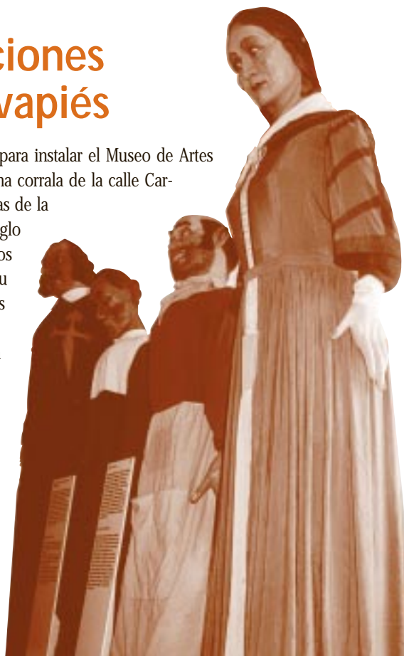
Gigantes de Madrid

El Museo distribuirá sus 2.481 metros cuadrados en plantas. La planta baja y la primera albergarán la exposición, la entreplanta exposiciones temporales y biblioteca, y el sótano, el salón de actos, aulas, talleres de restauración y almacenes.