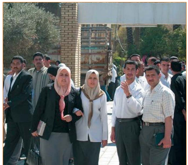
Exposición de fotografías. Estudiantes universitarios en Iraq.