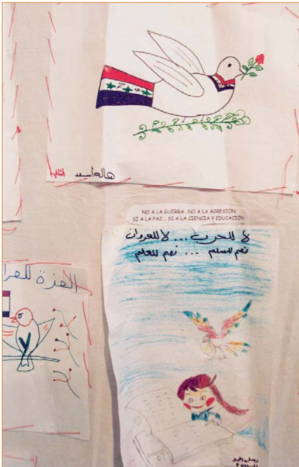
Dibujos realizados por niños iraquíes

En las conferencias se analizaron, entre otros asuntos de relevancia social, todo lo relativo a las políticas de economía social, su situación en la Unión Europea, su política fiscal, y sus agentes: cooperativas, fundaciones, asociaciones y empresas de inserción. Las experiencias e importancia de la nueva Economía Social en las diferentes áreas del Tercer Sector , profundizó en temas de inserción social, medio ambiente, cooperación internacional, drogodependencia, discapacidad, migraciones y género.