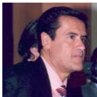
El Ministro de Justicia, Juan Fernández López Aguilar, asistió a la clausura de la jornada sobre la Constitución Europea, celebrada en la Facultad de Derecho.

Un grupo de estudiantes, residentes del Colegio Mayor Juan Luis Vives de la UAM, ha editado la revista Sobredosis , de publicación bi-mensual, con la que pretenden centralizar la información del Colegio y ofrecer la oportunidad de escribir en ella a los miembros de la comunidad universitaria.