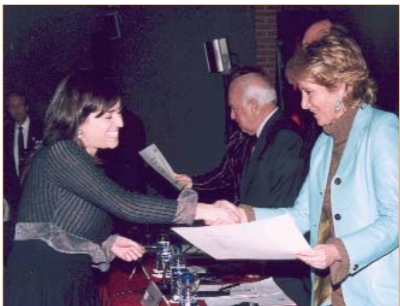
Esperanza Aguirre y Jesús de Polanco, en la entrega de diplomas.