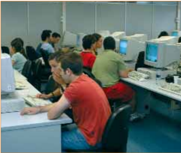
Aulas de informática