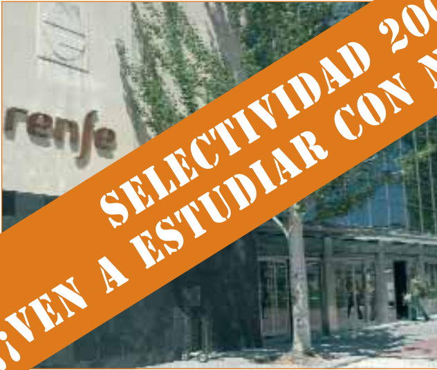
Tren de cercanías: Cantoblanco-Universidad