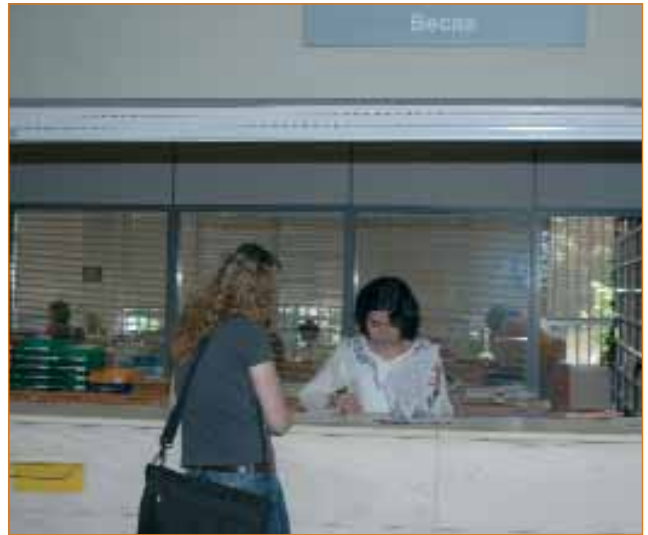
Sección de Becas