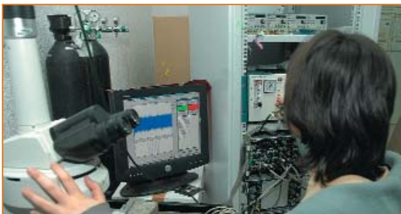
Equipamiento (set up) de electrofisiología.

Junto a todo ello, una de las actividades más tradicionales del INC y que más notoriedad internacional le dan es, sin duda, la organización todos los años en el mes de septiembre de la Escuela Internacional de Verano Nicolás Cabrera en las instalaciones de la UAM en la residencia La Cristalera, en Miraflores de la Sierra, gracias, entre otros, a la aportación financiera de la Fundación BBVA, absolutamente imprescindible para el desarrollo de la misma.