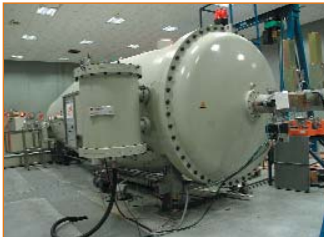
Acelerador de iones (CBM).

El Parque está consolidado en cuanto a sus objetivos y los servicios que debe prestar a la comunidad universitaria. En cuanto a su desarrollo en sí, el PCM no tiene un límite definido, no se puede decir que estemos en un porcentaje determinado de desarrollo respecto a un objetivo cerrado. El Parque es una institución, una herramienta que dará de sí todo lo que sea necesario, todo lo que la Universidad y la sociedad requieran. Acabamos de duplicar los espacios disponibles para incubación empresarial, de 4.000 a 9.500 metros, porque había demanda y hemos llegado a la saturación del espacio físico disponible;