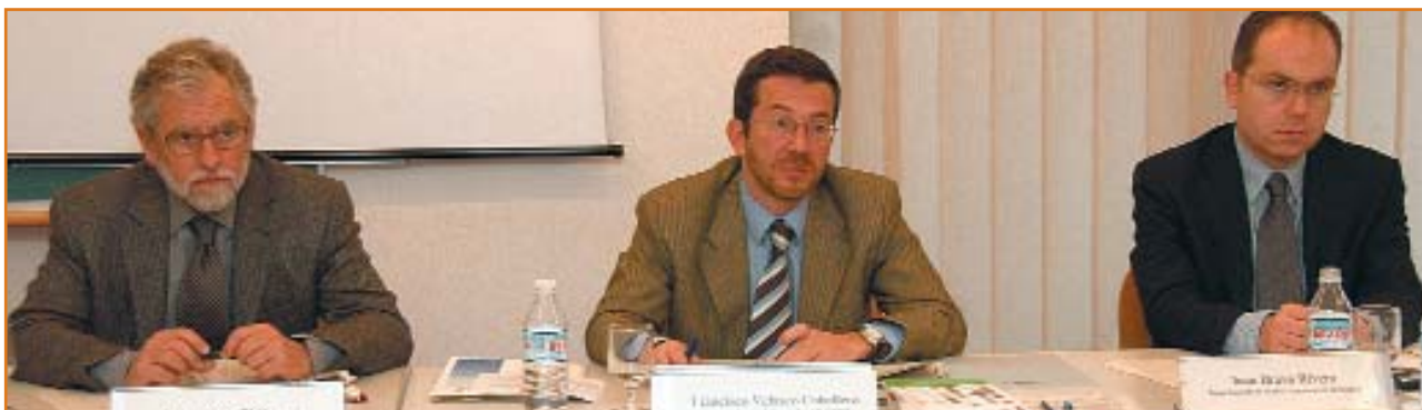
El IDL organizó el seminario "Gobiernos locales y áreas metropolitanas en el Estado autonómico español".

El Instituto de Derecho Local, de reciente creación (mayo 2003), tiene sin embargo una amplia experiencia en el cumplimiento de sus objetivos, que son la promoción de la investigación y formación de excelencia en un sector definido del Derecho Público: el Derecho Local.