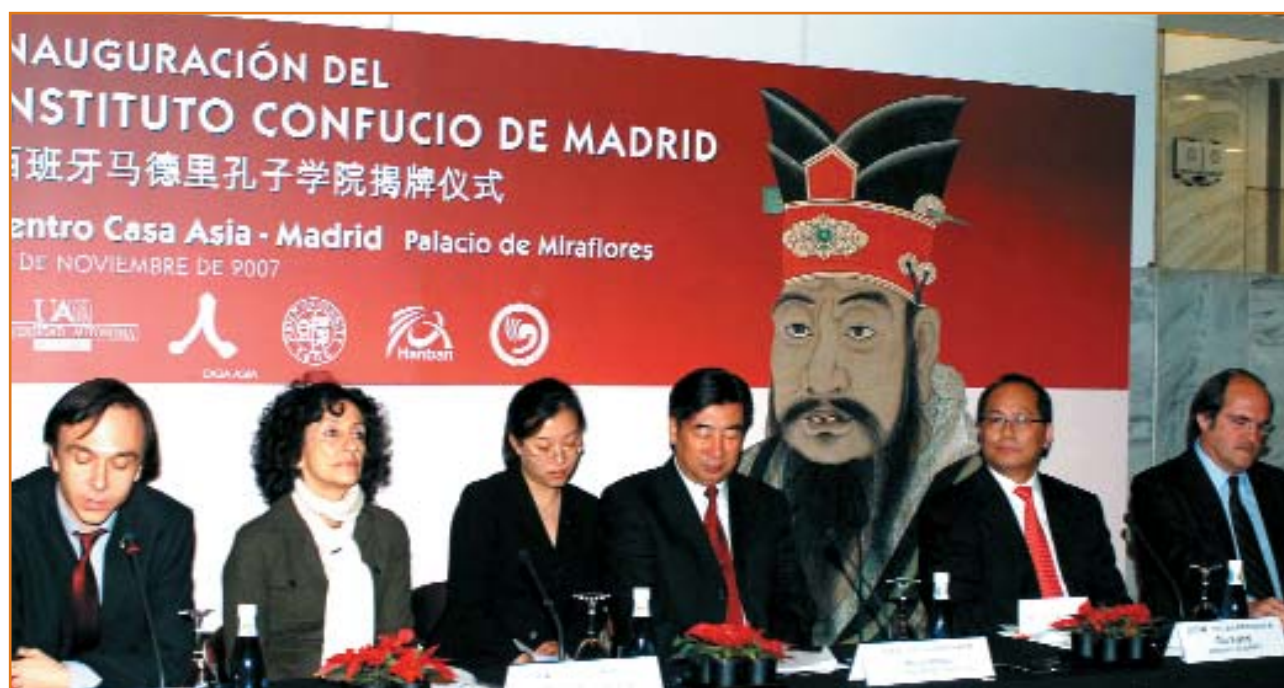
El director general de Casa Asia, Jesús Sanz, la ministra de Educación y Ciencia, Mercedes Cabrera, el viceprimer ministro chino, Hui Liangyu, el embajador de la República Popular China, Qui Xiaoqui, y el rector de la UAM, Ángel Gabilondo

Casa Asia, en colaboración con la Universidad Autónoma, inauguró en Madrid, el pasado 25 de noviembre, la primera sede del Instituto Confucio en España.