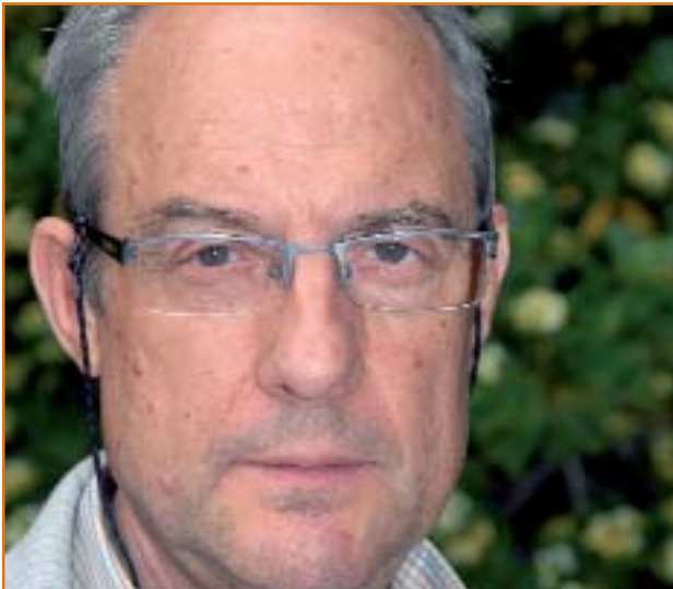
Amalio Blanco Abarca

EL JUEVES 4 DE JUNIO, EN PRIMERA VUELTA, LA COMUNIDAD UNIVERSITARIA DE LA UNIVERSIDAD AUTÓNOMA DE MADRID TIENE UNA CITA CON LAS URNAS: ELECCIÓN DE RECTOR. SI FUERA NECESARIA UNA SEGUNDA VUELTA, ÉSTA SE PRODUCIRÍA EL 17 DE JUNIO.