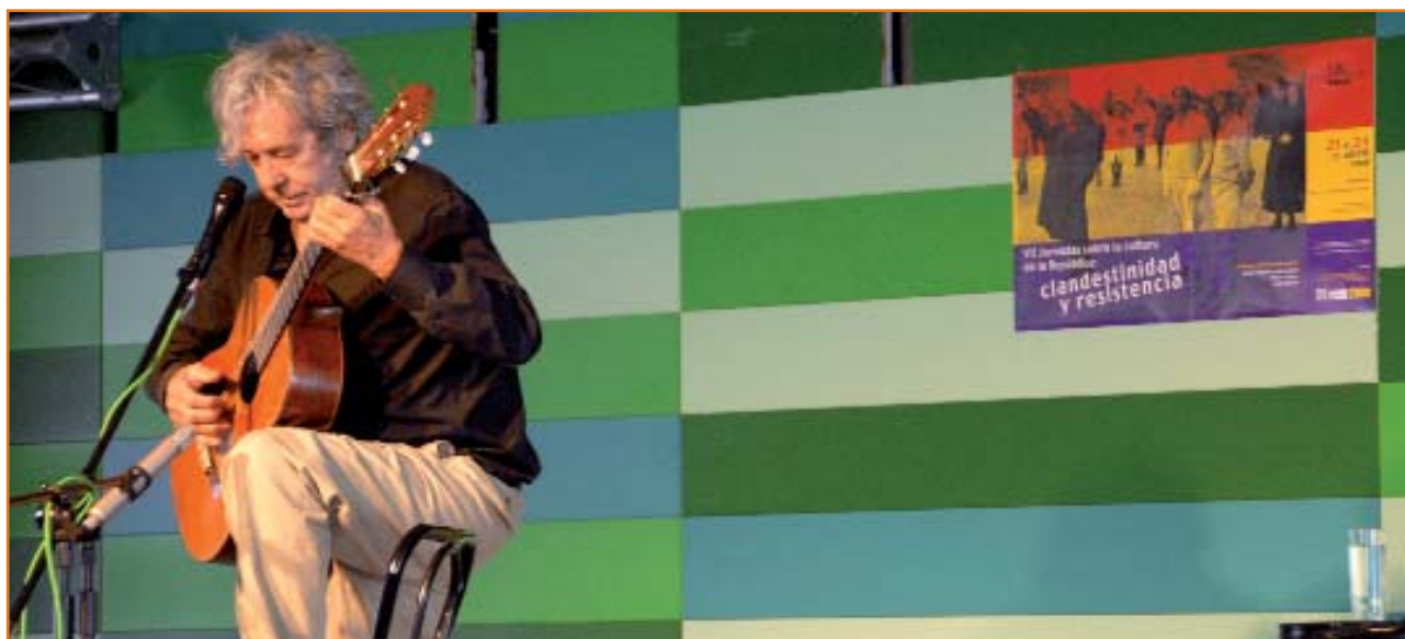
El cantautor Paco Ibáñez participó en la séptima edición de las Jornadas sobre Cultura de la República, celebradas en la UAM el pasado mes de abril.