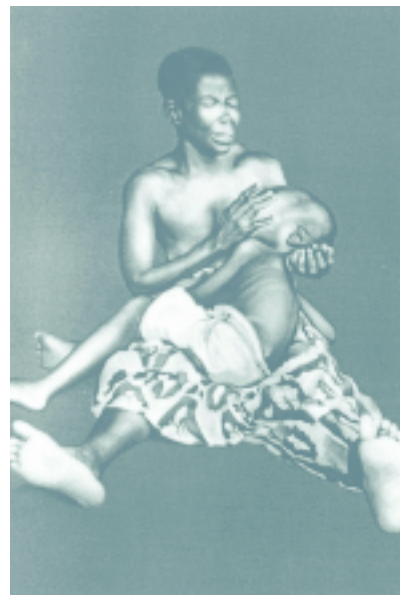
"Sin título", óleo sobre tabla de Alberto Illescas