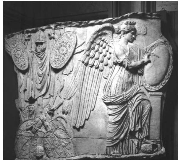
Fig. 2. Victoria inscribiendo sobre un clipeus junto a un trofeo de armas de la Columna Trajana. Copia del Museo de la Civilización Romana.

El tropaion de la guerra de hoplitas no era un monumento conmemorativo; era la marca de la victoria, aunque de forma transitoria, ya que al estar construido en un armazón de madera, con armas y ropajes no podría durar eternamente, algo que no ocurriría con los trofeos pétreos cuyo fin era perpetuar la evocación de la victoria y con ello el de la batalla y el de los vencedores. Esto