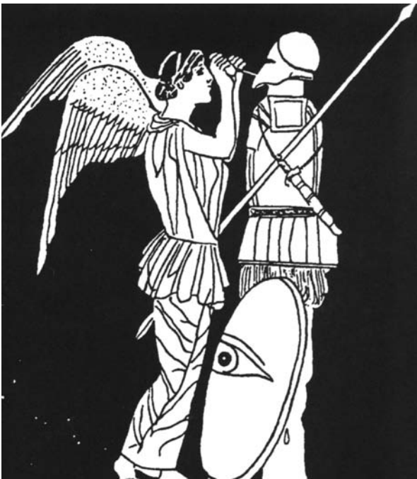
Fig. 1. Detalle de la pélice del Museo de Boston ("Pintor del Trofeo", siglo V a. C.), en el que una Niké construye el trophaion .

Olimpia por Milcíades, posiblemente después de Maratón, o quizá antes 8 .