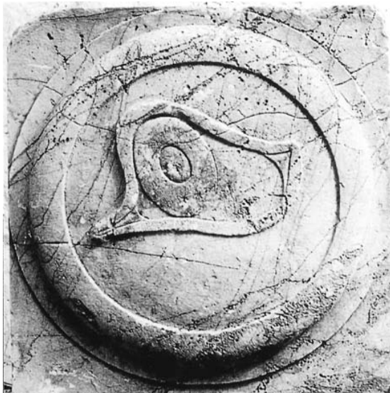
Fig. 6. Escudo decorado con un gran ojo apotropaico del monumento de Djebel Chintou (Túnez).

Lo mismo puede decirse de algunas de las armas que decoran el monumento númera de Chintou, “Simitthu” (Túnez), construido por Micipsa a mediados del siglo II a. C., convertido después en un templo del dios Saturno. Como otros monumentos helenísticos el edificio está decorado con alternancia de corazas y escudos (fig. 6) que no representan armas enemigas ni trofeos, sino armamento decorado con elementos simbólicos vinculados quizá con alguna divinidad 40 .