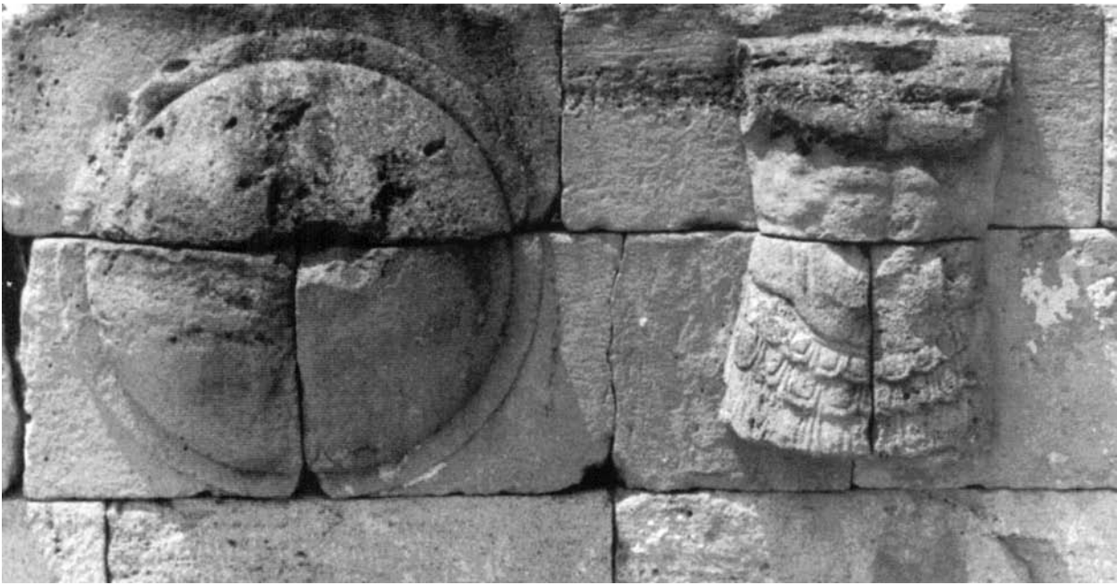
Fig. 5. Detalle del Monumento de los Escudos de Dión (Macedonia).

Las armas en tanto que instrumentos de combate, están ligadas también a la celebración de la victoria, sobre todo las armas capturadas en el campo de batalla, ya que se identifican con el enemigo y simbolizan su derrota.