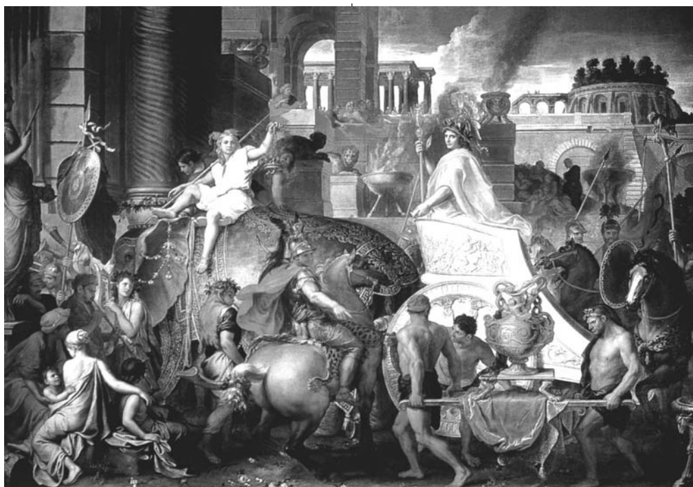
Fig. 7. Gran lienzo que el pintor del barroco francés Charles Le Brun (1619-1690) pintó para Luis XIV. Representa la entrada triunfal de Alejandro en una fastuosa Babilonia, reflejando la gloria militar y las virtudes del monarca macedonio. Museo del Louvre.