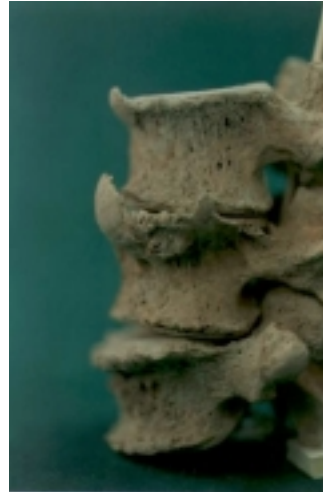
Artrosis en articulación de la rodilla