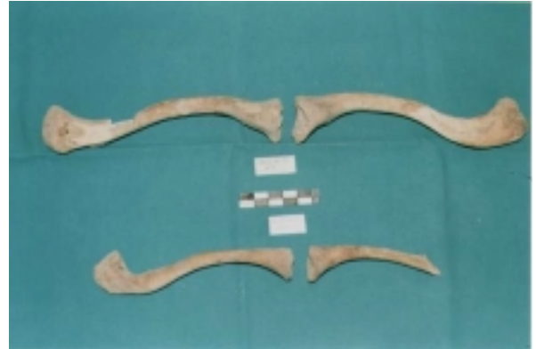
Alteraciones artrósicas en clavículas