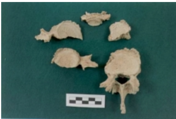
Alteraciones artrósicas y aplastamiento vertebral