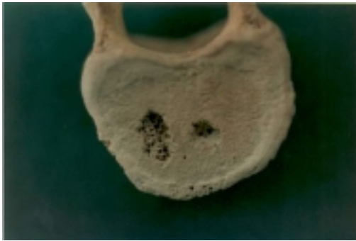
Núcleo de Schmorl