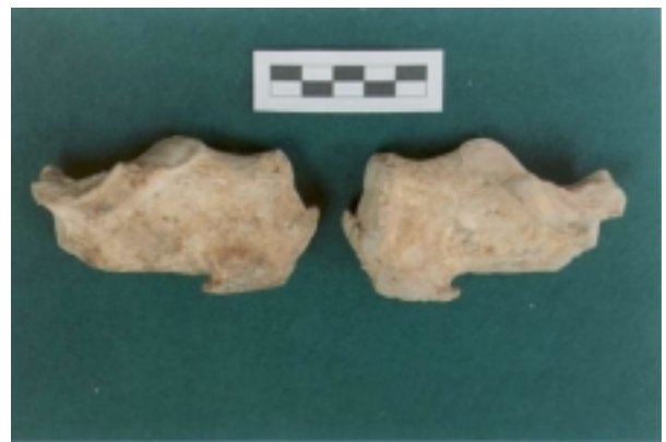
Exóstosis en calcáneos