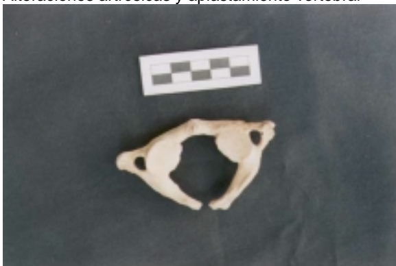
Falta de fusión del arco posterior del atlas