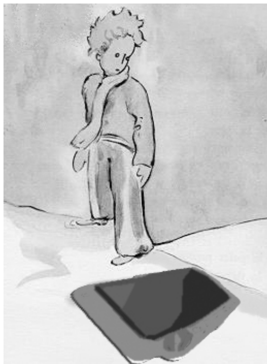
Fig.1: ¿Cómo la ves?

La TV es uno de los medios de comunicación de mayor influencia. ¿Pero influencia para qué? Para lo que se decida hacer y transmitir. Por ejemplo: en Nueva Zelanda, Bolivia o Zimbawe - por citar algunos lugares conocidos-, se sabe de algunas ciudades españolas merced a la liga de fútbol... G. Sartori (2003) ha definido a la televisión como la más grande agencia de formación de la opinión pública (p. 27). Su punto de vista acerca de este medio de comunicación es que: “la televisión ha entrado en una carrera competitiva decadente cuyo producto final es, primero, una información reducida; segundo, información improvisada e inútil, y tercero, una desinformación absoluta” (p. 33).