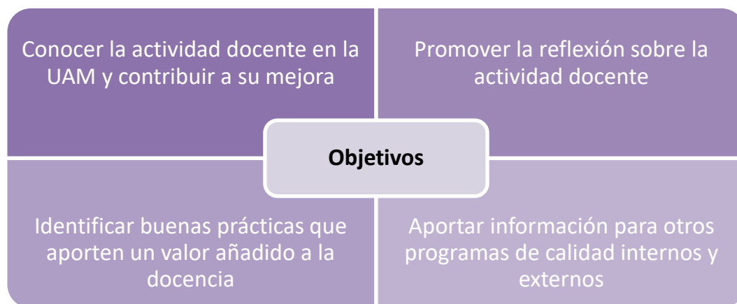
FIGURA 1: Objetivos del programa DOCENTIA-UAM

La convocatoria actual está dirigida a los docentes que hayan impartido docencia, mínimo durante dos de los últimos cursos académicos 2013-2014, 2014-2015, 2015-2016, 2016-2017 y 2017-2018, periodo objeto de evaluación. En el apartado 3.1 de esta Guía se detallan los Criterios de participación.