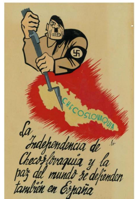
Detalle de un cartel de propaganda republicana que caricaturiza los intereses alemanes en Checoslovaquia (invasión de los Sudetes y el resto de Checoslovaquia) 1938.

Con este legado se enriquece y complementa el fondo documental general de la Residencia de Estudiantes con información de primera mano sobre la situación política y militar de España entre 1931 y 1952.