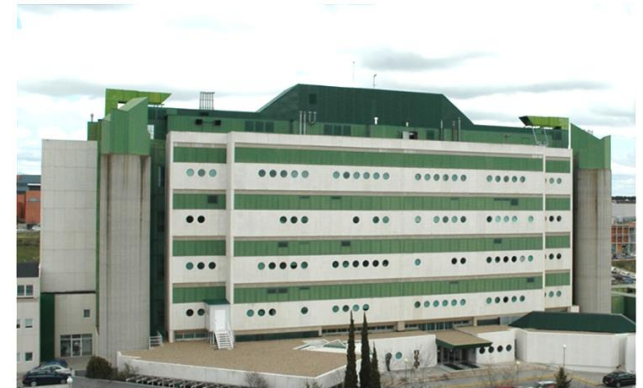
Centro Nacional de Biotecnología (CSIC)