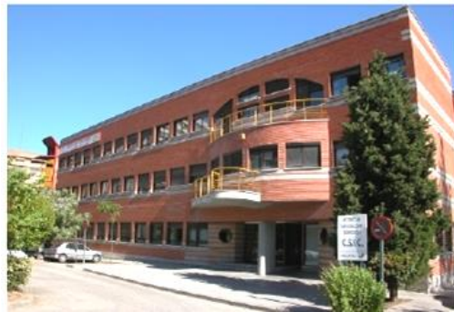
Instituto de Investigaciones Biomédicas Alberto Sols (UAM-CSIC)