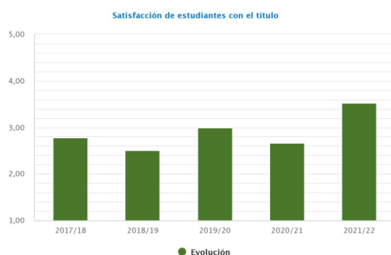
Gráfico 4: Evolución del índice de satisfacción de los estudiantes con el título

La satisfacción de los estudiantes con el MUAPA ha mejorado considerablemente en el curso 2021/2022: 3,53/5. Esto supone una subida del 32,21% respecto del curso anterior (2,67/5). En el siguiente gráfico puede verse la evolución del indicador, que da cuenta que las acciones de mejora emprendidas a lo largo de los últimos cursos están arrojando resultados positivos.