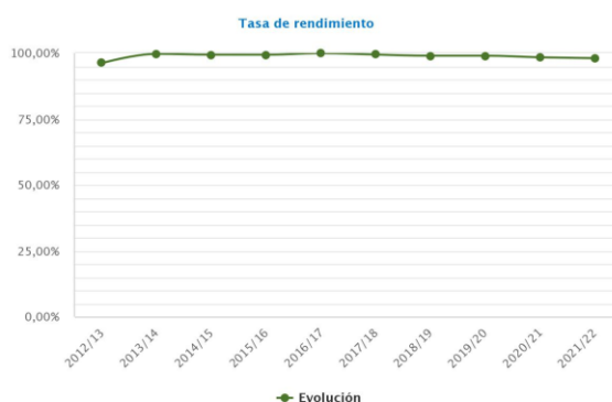
Gráfico 2: Evolución de la tasa de rendimiento