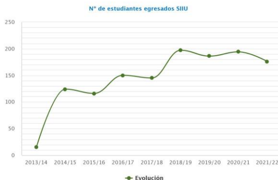
Gráfico 3: Evolución del número de estudiantes egresados SIU

Respecto del número de egresados SIU , esto es, el recuento de estudiantes que han superado o reconocido los créditos necesarios y suficientes para obtener el título de Máster (con independencia de haber abonado las tasas correspondientes o de estar a falta de algún requisito que pida la Universidad) ha sido de 176, lo que supone una diferencia de 9,68% a la baja respecto del curso anterior (194). Este dato, sin embargo, de ser leído en relación con los últimos cursos, se mantiene prácticamente en niveles constantes.