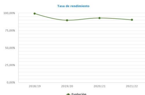
Gráficos 3. Evolución de la tasa de rendimiento del MIJ (izquierda) y del Doble Máster (derecha)