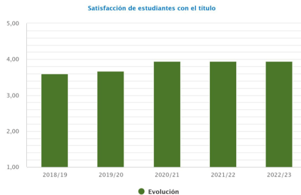
Gráfico 4. Evolución del índice de satisfacción de estudiantes con el Título

Cabe destacar la sustantiva mejora de la satisfacción de los estudiantes con las prácticas externas del GD, que llega al 4,8/5, lo que supone una mejora del 12,94%.