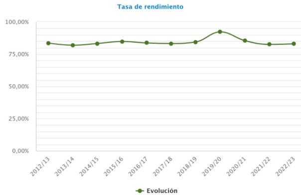
Gráfico 3. Evolución de la tasa de rendimiento