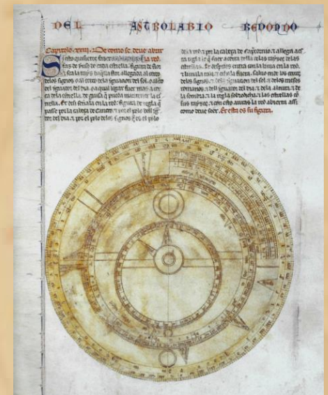
Libros del saber de Astronomía de Alfonso X

Un somero repaso por la Historia del libro y la tipografía servirá de presentación a los libros expuestos en las vitrinas: desde fac-símiles como los Libros del saber de astronomía del Rey Alfonso X o el Libro de la Real Cofradía de los Caballeros , al libro más antiguo de la biblioteca, las Comœdiæ de Plauto (1605). También veremos diversos ejemplares salidos de las imprentas de Sancha e Ibarra, libros con autógrafos que los hacen especiales o una selección de libros curiosos procedentes del fondo de Raros. Para terminar, en la última vitrina presentamos diversos ejemplos de restauración de libros antiguos.