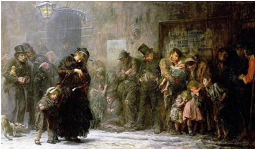
"Applicants to a casual ward" ("Solicitantes de asilo temporal") Sir Samuel Luke Fildes, 1874. Óleo sobre lienzo. Royal Holloway College, University of London

Chesterton dijo de Charles Dickens (1812-1870) que era "tan universal como el mar..." Al cumplirse los 200 años de su nacimiento podemos comprobar su vigencia a través del tiempo.