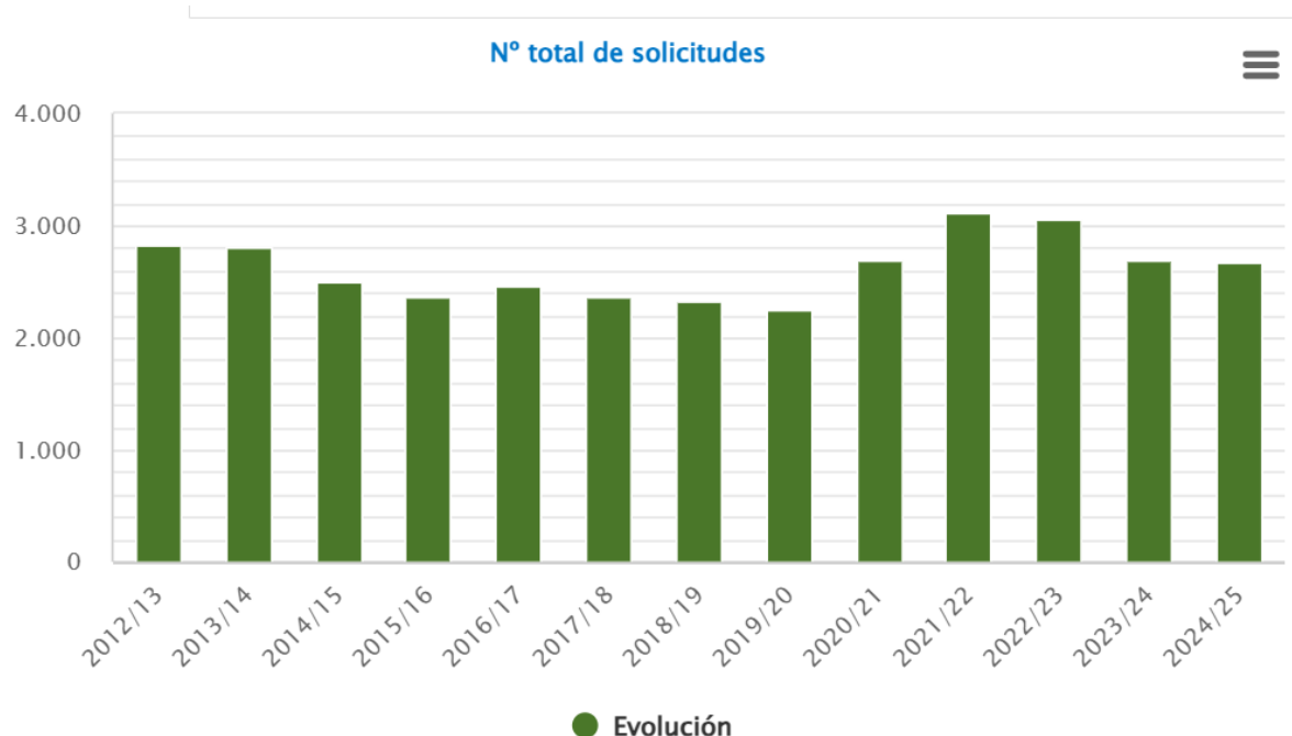
Figura 1: Número de solicitudes, curso 2024-2025

El número total de solicitudes para acceder al Grado en ADE de la UAM ascendió a 2.669 (figura 1), una cifra muy similar a la del curso anterior. La oferta de plazas en este título se mantuvo en 290, al igual que en los cursos precedentes. El total de estudiantes de nuevo ingreso