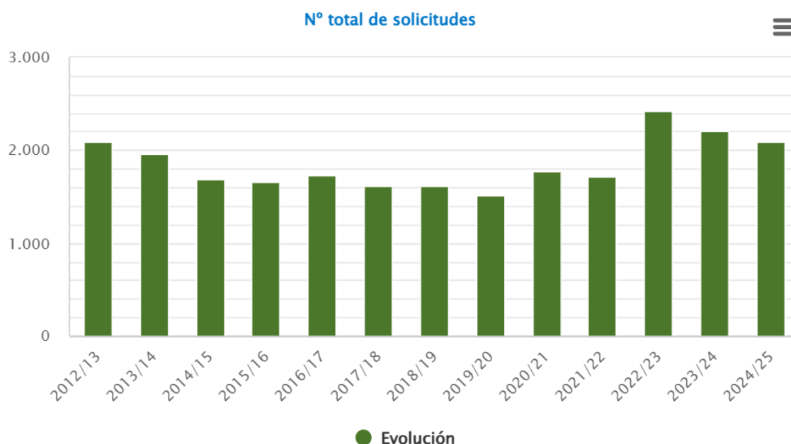
Figura 1. Número de solicitudes, curso 2024-2025

En el curso 2024-2025, se ofertaron 230 plazas de nuevo ingreso en el Grado en Economía, si bien la política de la UAM considera adecuada una franja de +/-10% de estudiantes de nuevo ingreso respecto a las plazas señaladas en la Memoria del título. Esto ha supuesto que el número de estudiantes matriculados en primero ascendiera a 237 de forma que la cobertura se sitúe en torno al 100%.