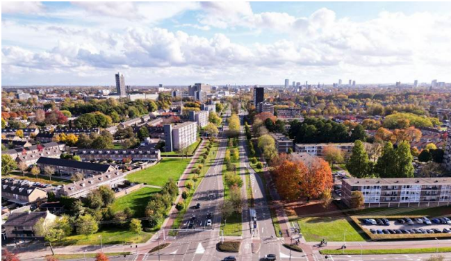
Eindhoven, Países Bajos

Universidad buena y con prestigio, asignaturas parecidas ningún problema con las convalidaciones alta cantidad de asignaturas para elegir, método de enseñanza mas teórico, gran cantidad de excursiones baratos por la conexión de la ciudad en cuanto al transporte