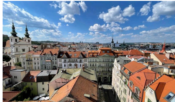
Brno, República Checa