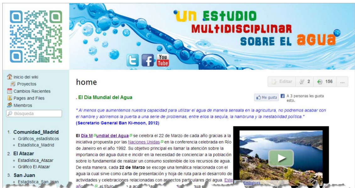
Fig.1: Captura de la página de inicio de la Wiki http://matembalses.wikispaces.com

Un estudio multidisciplinar sobre el agua cuenta en su estructura con varias partes diferenciadas, aunque no aisladas, dado que todas se complementan y adquieren significado gracias a la plataforma wiki y a la mediación de varias aplicaciones digitales. Con el fin de ejemplificar de una forma lo más simple posible cada una de las partes hemos realizado una agrupación atendiendo al carácter cualitativo y cuantitativo de cada una de ellas.