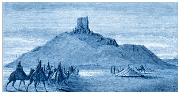
Birs Nimrud. S. Newman, 1876 (M.T. Larsen 1996: 47)

Durante sus viajes iba tomando notas que tal vez pensaba ampliar luego. Pero recién vuelto a “tierras de Castilla”, como diría el anónimo prologuista y editor de sus recuerdos difundidos en hebreo, murió sin llegar a hacerlo cuando pensaba emprender un nuevo viaje.