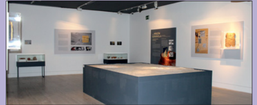
Sala de la exposición

Entre el 8 de abril y el 29 de mayo de 2016 tuvo lugar, en el Museo Arqueológico Nacional, la exposición " En los confines de Oriente Próximo " financiada por el Departamento de Antigüedades del Emirato de Sharjah. La exposición daba cuenta de veinte años de hallazgos del departamento y a la vez, de los veinte de trabajo de la misión española en al Madam (Sharjah), entre 1994 y 2014. La muestra fue organizada por el Grupo de Investigación de la UAM " Culturas, tecnologías y medio ambiente de las sociedades de Oriente Próximo antiguo ", y en el corto tiempo en el que pudo estar abierta mereció la visita de numeroso público y una generosa atención en los medios.