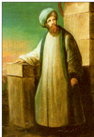
Retrato de Páez en Loyola

Desde su fundación, la Compañía de Jesús brilló por el alto nivel intelectual de sus miembros, la excelente educación dada en los colegios que fundara y su labor misionera en los extremos del mundo. Ello facilitó que durante los siglos XVI y XVII, los jesuitas fueran verdaderos viajeros y exploradores de tierras remotas, y que sus libros, cartas e informes - como San Ignacio demandaba-, resultaran en un conjunto riguroso y rico sobre costumbres, viajes, exploraciones por todo el mundo y, claro es, por Oriente Próximo, Medio y Lejano. San Francisco Javier en India, Malaca y Japón, Bento de Gois en Asia Central o Pedro Páez en Yemen y Etiopía simbolizan una época asombrosa.