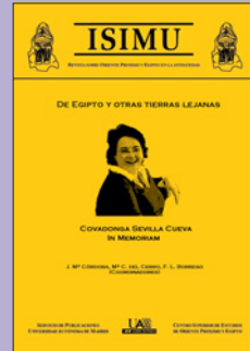
Isimu 2016, dedicada a C. Sevilla

Acaba de publicarse el nº 19 (2016) ISIMU, en memoria de la Prof. Sevilla, fallecida en junio de 2016. La revista fue presentada en Filosofía y Letras, dentro de un acto dedicado a su recuerdo. Unas 40 personas entre autores de artículos, diseño y maquetación del volumen han prestado su esfuerzo. En el acto se glosó la trayectoria profesional de la profesora y se explicó el contenido del volumen. Se cerró el acto con la interpretación de una obra musical.