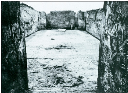
Salón del trono del Palacio de Mari

Durante los años sesenta del siglo XX, muchos estudiantes europeos se sintieron atraídos por el Oriente Próximo antiguo tras la lectura de un libro fascinante, de magníficas reproducciones b/n en huecograbado: Sumer (L'Univers des Formes, Gallimard, Paris, 1960-61. Ed. española: Sumer , Aguilar, S. A., Madrid 1969). Por entonces también y en el seno de las universidades, obras más exigentes fueron clave en la formación de jóvenes orientalistas: Archéologie mésopotamienne. Les étapes (Éditions Albin Michel, Paris 1946 –con Archéologie mésopotamienne. Technique et problèmes (Éditions Albin Michel, Paris 1953)-, y Ziggurats et tour de Babel (Éditions Albin Michel, Paris 1949). De todos ellos era autor el director del Museo del Louvre y descubridor de Mari, André Parrot, todo un mito de la arqueología francesa en Oriente. Porque en la Europa de postguerra, Parrot y el palacio de Mari evocaban la última gran excavación en Oriente y el fin de toda una época.