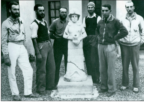
Equipo francés (1936). Segundo por la derecha, A. Parrot

Durante los años sesenta del siglo XX, muchos estudiantes europeos se sintieron atraídos por el Oriente Próximo antiguo tras la lectura de un libro fascinante, de magníficas reproducciones b/n en huecograbado: Sumer (L'Univers des Formes, Gallimard, Paris, 1960-61. Ed. española: Sumer , Aguilar, S. A., Madrid 1969). Por entonces también y en el seno de las universidades, obras más exigentes fueron clave en la formación de jóvenes orientalistas: Archéologie mésopotamienne. Les étapes (Éditions Albin Michel, Paris 1946 –con Archéologie mésopotamienne. Technique et problèmes (Éditions Albin Michel, Paris 1953)-, y Ziggurats et tour de Babel (Éditions Albin Michel, Paris 1949). De todos ellos era autor el director del Museo del Louvre y descubridor de Mari, André Parrot, todo un mito de la arqueología francesa en Oriente. Porque en la Europa de postguerra, Parrot y el palacio de Mari evocaban la última gran excavación en Oriente y el fin de toda una época.