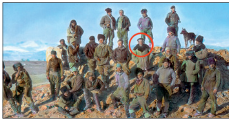
Miembros de la expedición. En círculo, T. de Chardin

"La Croisière Jaune" (1930-1932): un viaje de exploración interdisciplinar entre la costa libanesa y Pekín