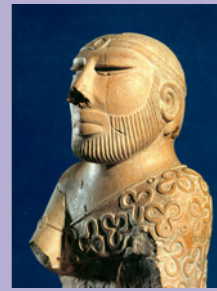
Príncipe de Meluhha

Entre los días 28 de noviembre y 1 de diciembre del primer cuatrimestre tendrá lugar la XVIII Semana Didáctica sobre Oriente Antiguo , dedicada en esta ocasión al tema Gentes de Meluhha. Las culturas del Indo y sus contactos con Oriente Próximo y Medio en el III milenio a. C. Se impartirá un ciclo de lecciones a cargo de especialistas y una pequeña exposición fotográfica.