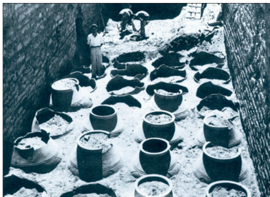
Karmir Blur – Teiše bai. Tinajas in situ

En 1929 accedió a la Academia de Historia e inició su larga relación académica con el Prof. N. Marr, que influyó en la orientación de B. B. Piotróvsky hacia el Cáucaso y la civilización urartia. En 1930 comenzó sus estudios sobre el terreno, que compaginó desde 1933 con el cargo de colaborador del Hermitage. Y en 1936 llegó el momento decisivo en su biografía: las excavaciones de Karmir Blur , colina cercana a Erevan, capital de la República Socialista de Armenia. Durante muchos años -con el intermedio de la II Guerra Mundial, que vivió en parte en el Leningrado asediado por los nazis-, B. B. Piotróvsky fue descubriendo la ciudadela de un enclave urartio, aplicando el método interdisciplinar propio de las misiones soviéticas. Salió así a la luz la primera y verdadera imagen de una ciudad del antiguo reino de Urartu, sus condiciones de vida, su economía y su entorno natural y agrícola. Y su historia: Teiše bai -nombre de la ciudad antigua- fue fundada por el rey Rusā II en el