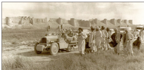
Vehículos de la expedición frente a las murallas de Herat (Afganistán)