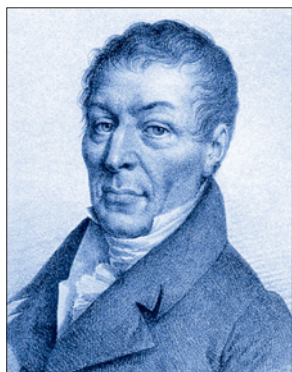
El Conde de Volney