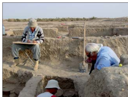
Sarianidi excavó en Gonur hasta su muerte

Entre 1957 y 1959 dirigió la excavación de Geoksyur, lugar eneolítico al sur de Turkmenistán, que motivó en parte su tesis doctoral sobre Tribus de agricultores el Sudeste de Turkmenistán , defendida en Moscú (1963), y con la que obtuvo gran reconocimiento. Tras algunas intervenciones en el Cáucaso se volcó en Turkmenistán, en yacimientos singulares de la Edad del Bronce como Ulug Depe y Altyn Depe (1966-1969). Poco después, el libro Central Asia. Turkmenia before the Achaemenids (Londón 1972), del que fueron autores él y su amigo V. M. Masson, asentó su prestigio en Occidente. Por aquellos años codirigió también la misión afgano-soviética en Tillia Tepe (1969-1979), que sacó a la luz la cultura real del Imperio Kushano. Pero desde los años setenta se centró sobre todo en las llanuras de Merv, donde prospectó o excavó unos 200 yacimientos, desde el Bronce al Hierro. Gracias a su labor, la Margus de las inscripciones de Dario I quedó descubierta, y más aún cuando en Gonur Depe encontró la capital del antiguo reino de Marhaşi, una ciudad inmensa fechada entre el III y el II milenio a. C. que ha proyectado su fama por todo el mundo.