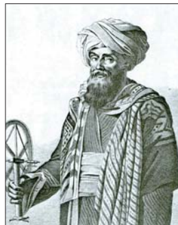
Domingo Badía como Ali Bey

Entre los grandes viajeros europeos, que durante el siglo XIX consiguieron entrar en La Meca, destaca el español D. Badía y Lebllich, acaso menos conocido que el suizo J. L. Burckhardt o el inglés R. Burton. Sin embargo, la aventura de Badía fue tan heroica y expuesta como la de aquellos, excediéndoles en la audacia de sus objetivos. Nació en Barcelona (1.4.1767), hijo del secretario del gobernador. Siguió a su padre por España en sus varios destinos, formándose en distintos como idiomas, dibujo, ciencias, geografía, astronomía o arquitectura militar. Lector incansable, editor de curiosos estudios, miembro de la administración del estado, trazó un proyecto de viaje a África que presentó a M. Godoy en abril de 1801. Godoy lo modificaría para convertirlo en una operación encubierta de conquista de Marruecos. Badía, transformado en el Príncipe Ali Bey al Abasí –pero a las órdenes del coronel Amorós y el general Castaños–, desembarcó en Tánger en junio de 1803. Se introdujo en la corte y ganó la amistad del sultán y, a punto de pasar a la acción, luchas internas, la situación internacional y las órdenes y contraórdenes abortaron la operación. Tuvo que huir de manera discreta, como peregrino a La Meca. Cruzó el Mediterráneo, exploró Egipto y navegó el Mar Rojo. A escondidas escribía, dibujaba, tomaba latitudes. Y en enero de 1807 llegó a La Meca.