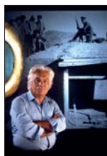
V. I. Sarianidi en su madurez

El día 23 del mes de diciembre de 2013, a los ochenta y cuatro años de edad, falleció en Moscú el Profesor Dr. Víctor Ivánovich Sarianidi, uno de los ya legendarios arqueólogos soviéticos y rusos, que como B. A. Litvinsky, S. P. Tolstov, M. E. y V. M. Masson, A. A. Marushenko, G. A. Pugachénkova y tantos otros, con voluntad y sacrificios hoy impensables sacaron del olvido la brillante Historia Antigua y Medieval de los pueblos de Asia Central. Con él desaparece además el último de los grandes de nuestra ciencia, de estudiosos que como P. E. Botta con los asirios, G. de Sarzec con los sumerios, R. Koldewey con los babilonios o P. Matthiae con los eblaítas, han sido felices pioneros en una parte relevante de la Antigüedad. Porque con V. I. Sarianidi se va el redescubridor de Margus y las gentes del remoto Marhaşi.