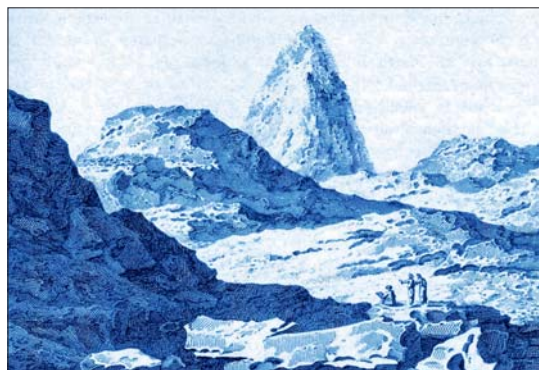
Yebel al Nur, en la Meca, según A. Bey