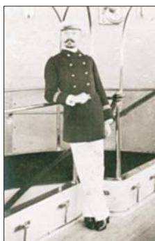
Loti oficial de marina (B. Vercier, 2006: 5)

Durante el siglo XIX, muchos escritores quisieron viajar a Oriente. Los más transitaron por Levante, como Chateaubriand, Lamartine o Flaubert, poco proclives a adentrarse en territorios más problemáticos. Para otros, sin embargo, el viaje al Oriente profundo fue una vivencia que les marcó siempre, por ejemplo, a Pierre Loti.