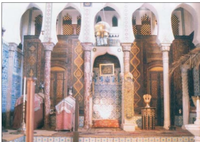
Sala en su casa de Rochefort (E. Bloch 2005)