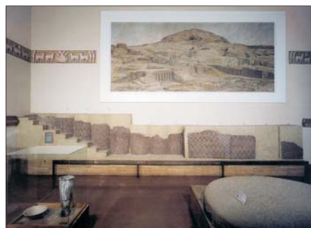
Sala de Uruk, Vorderasiatisches Museum (Wedel 2003: 100)