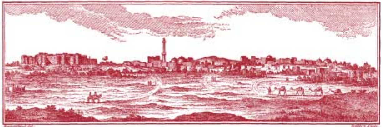
Dibujo de Beittel-Fakih por Baurenfeind, artista miembro de la expedición de Niebuhr