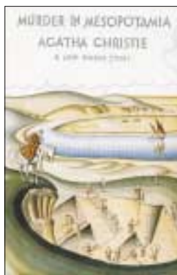
Célebre novela de A. Christie escrita en Chagar Bazar