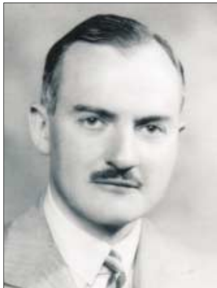
Mallowan hacia 1930