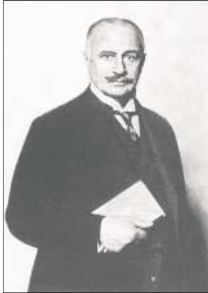
Fotografía de Max von Oppenheim (1860-1946)

un museo para exhibir los hallazgos de Tell Halaf, pero durante la II Guerra Mundial, entre el 22 y el 26 de noviembre de 1943, los bombardeos aliados destruirían los edificios y los fondos reunidos. Quebrantada su salud por la edad y las penalidades de la guerra, murió en Landshut el 15 de noviembre de 1946. Con razón, una inscripción sobre su tumba dice: “Descansa aquí en la paz de Dios un hombre que amó la ciencia, el Oriente, el desierto y el Tell Halaf por él descubierto y excavado”. Sus obras, los monumentales volúmenes de la serie Tell Halaf, editados en parte tras su muerte, su fundación aún existente y una palabra, Tell Halaf, estarán siempre vinculados con su recuerdo.