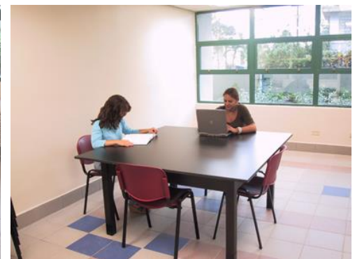
Sala de estudio grupal