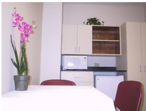
Mesa comedor y cocinilla