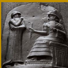
Estela del Código de Hammurabi (Louvre Sb 8)

Curso de Corta Duración 2021-2022 Enteramente online 2 créditos ECTS